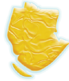
une île à explorer